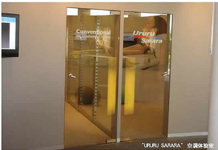
“URURU SARARA” 空调体验室